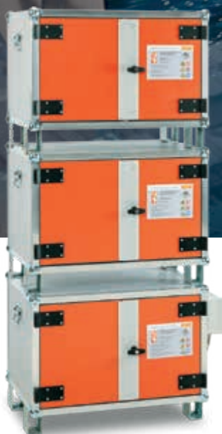
Akku-Lager- und Ladeschrank 8/5 Laden und/oder lagern von mehreren Lithium-Akkus im Schrank. Frühzeitige Alarmierung im Schadensfall.