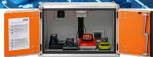
Akku-Ladeschrank 8/5 Stromversorgung durch 4-fach Steck- dosenleiste. Kompaktes Außenmaß.