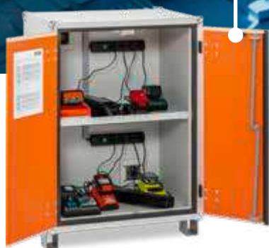
Akku-Ladeschrank 8/10 Ladevarianten mit 2 waagrecht ange- ordneten 4-fach Steckdosenleisten zur Stromversorgung.